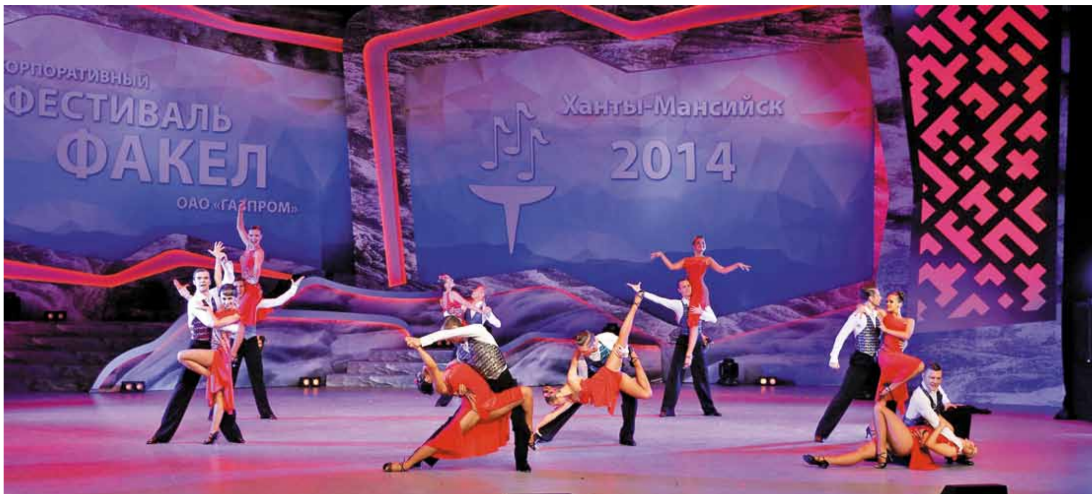
Танцевальный коллектив «Музыка сердца»