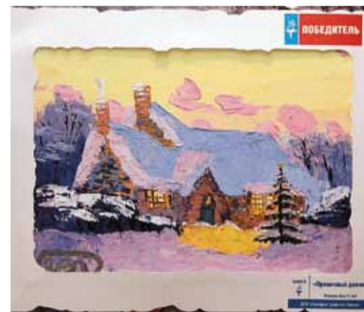
Рисунок «Пряничный домик» Яны Рожневой занял первое место в конкурсе рисунков