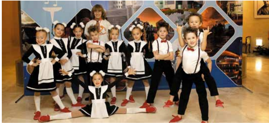
Позитивный, современный ансамбль «Оранжевый кот» (1 место)