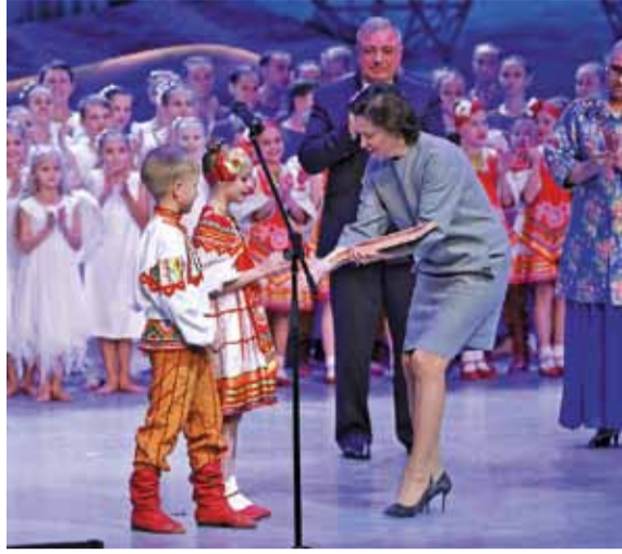
Первый гран-при у «Веснушек»