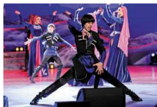
Ансамбль горского танца «Дайможк»