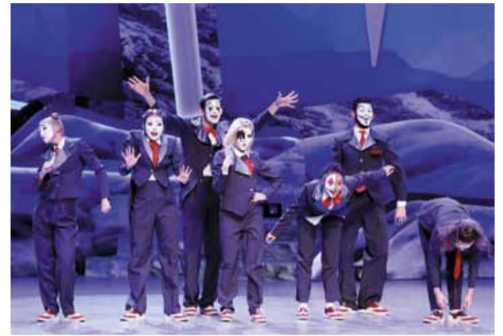
«Джазовые бродяги» удивляли, вдохновляли, веселили (1 место)