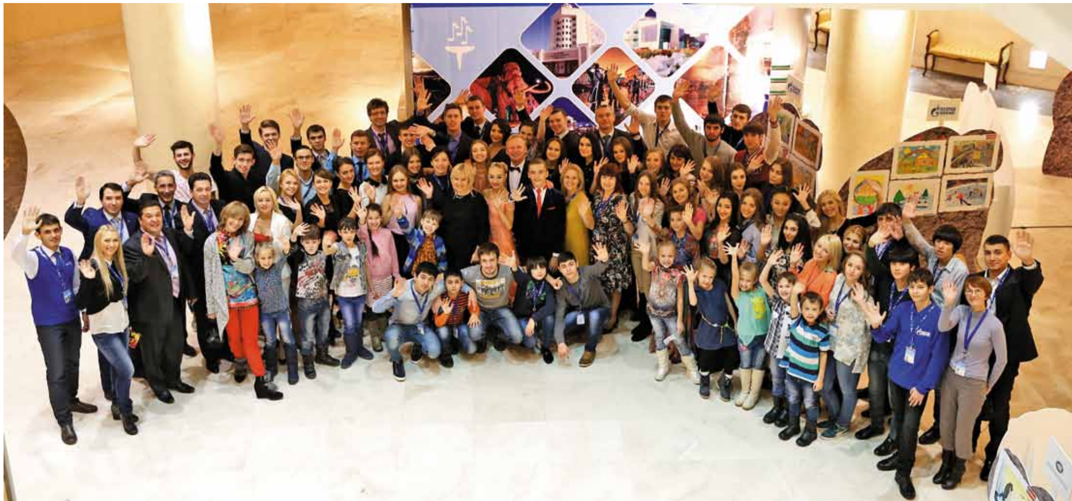
Самая многочисленная и счастливая команда