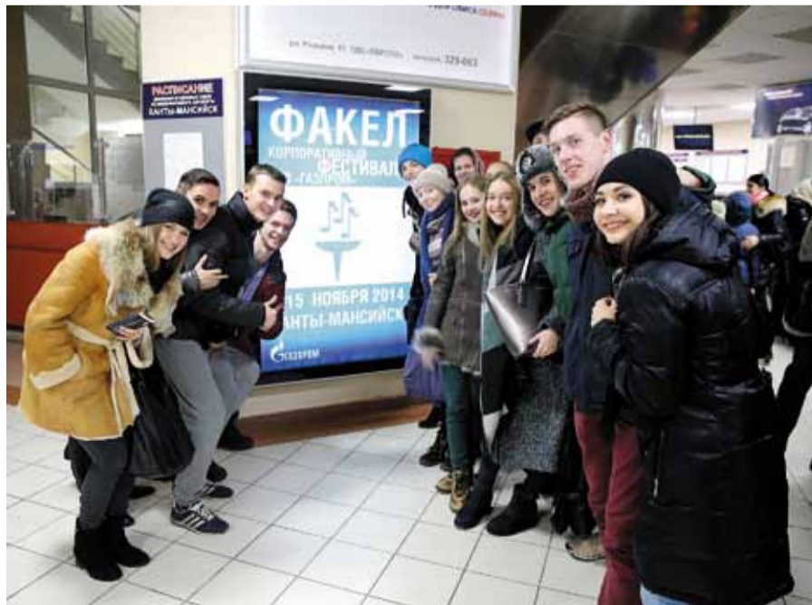
Мы прилетели побеждать!