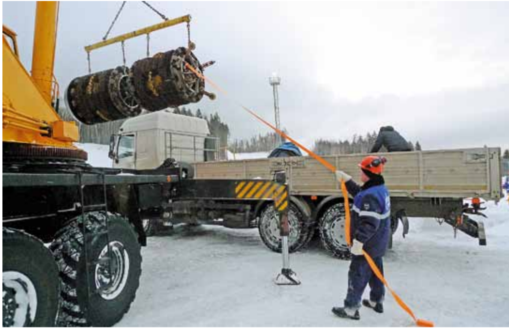
Сильный циклон не стал преградой в работе газовиков

В условиях сурового дальневосточного климата газовикам пришлось столкнуться с настоящими испытаниями, преодолеть которые возможно только выносливым, знающим свое дело профессионалам. Сотни километров без-