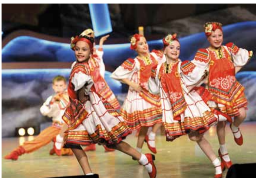
Открытием фестиваля стали новокузнецкие коллективы – «Веснушки» и «Аура»