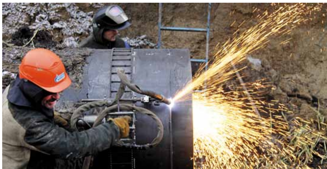
Плазменный резак «Орбита» в умелых руках ремонтников работает быстро, эффективно и красиво

Барабинские степи в ноябре – место безрадостное: на сколько хватает взгляда – травяной сухостой на гладкой как стол равнине с встречающимися проплешинами озёр. Одна из версий происхождения топонима «Бараба» – «многоводье» в переводе с татарского. Заболоченные земли здесь занимают больше 12% территории, и во время весенних разливов Бараба иногда действительно похожа на море. Барабинск, Куйбышев (Канск), Татарск являют собой хрестоматийный пример городков, удалённых от мегаполисов, а вместе с этим и от привычных благ цивилизации в виде торговых центров, хороших дорог, комфортабельных гостиниц