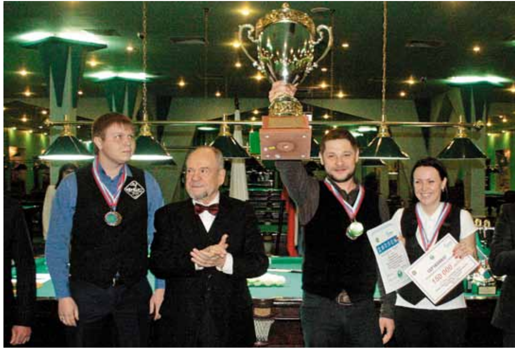
Кубок команды победителей у бильярдистов «Газпром трансгаз Томск»

Перед нашей сборной ставилась лаконичная задача-максимум: вернуть себе звание чемпионов в командном зачете, утерянное год назад. Попросту – максимум должен быть достигим.