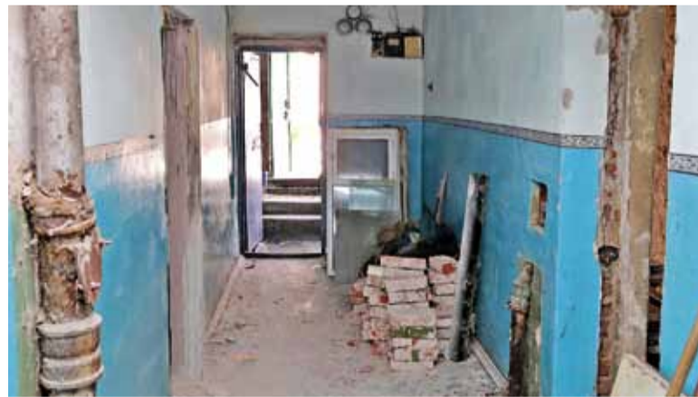
Снимки «до» и «после» ремонта этого помещения лучше всяких слов говорят о дистанции между мечтой и ее реализацией: от груд строительного мусора и ржавых труб до евростиля и яркой и удобной мебели. Быть причастным к исполнению мечты – особая радость. И это чувство дорогого стоит