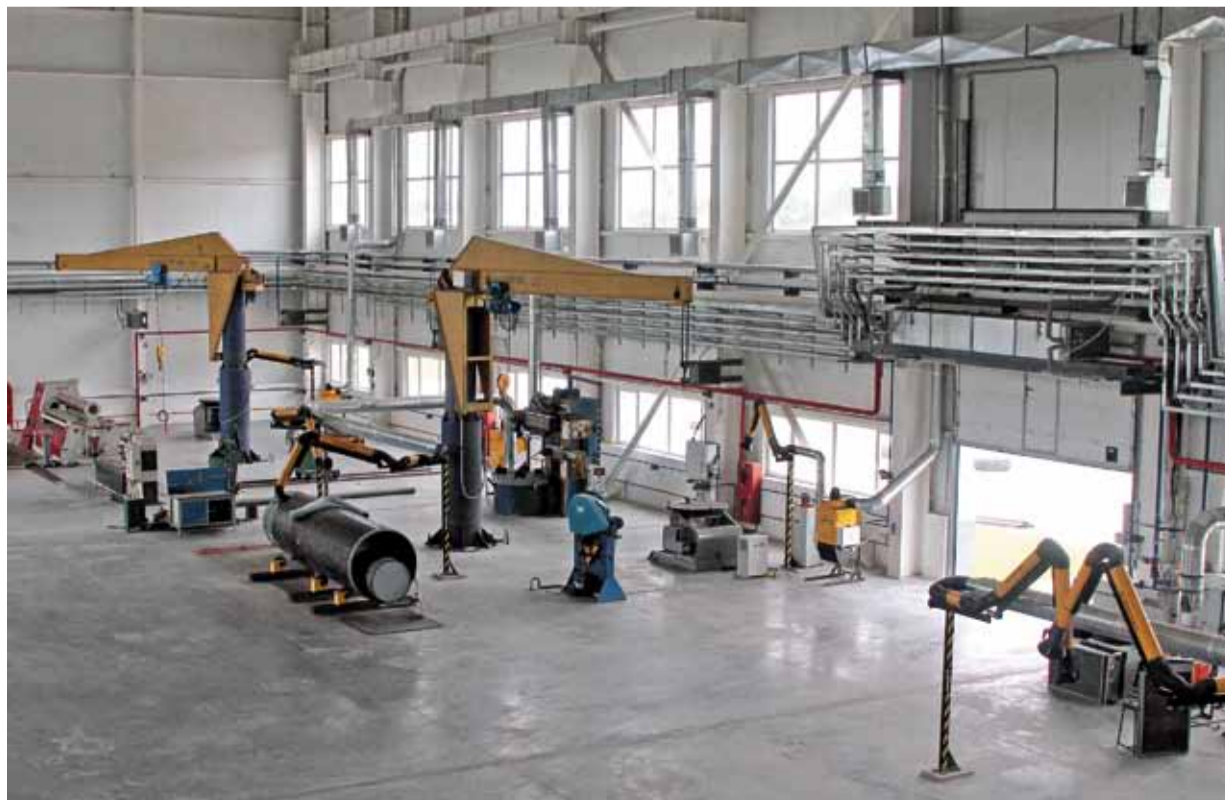
Сварочный полигон Хабаровского ЛПУМГ