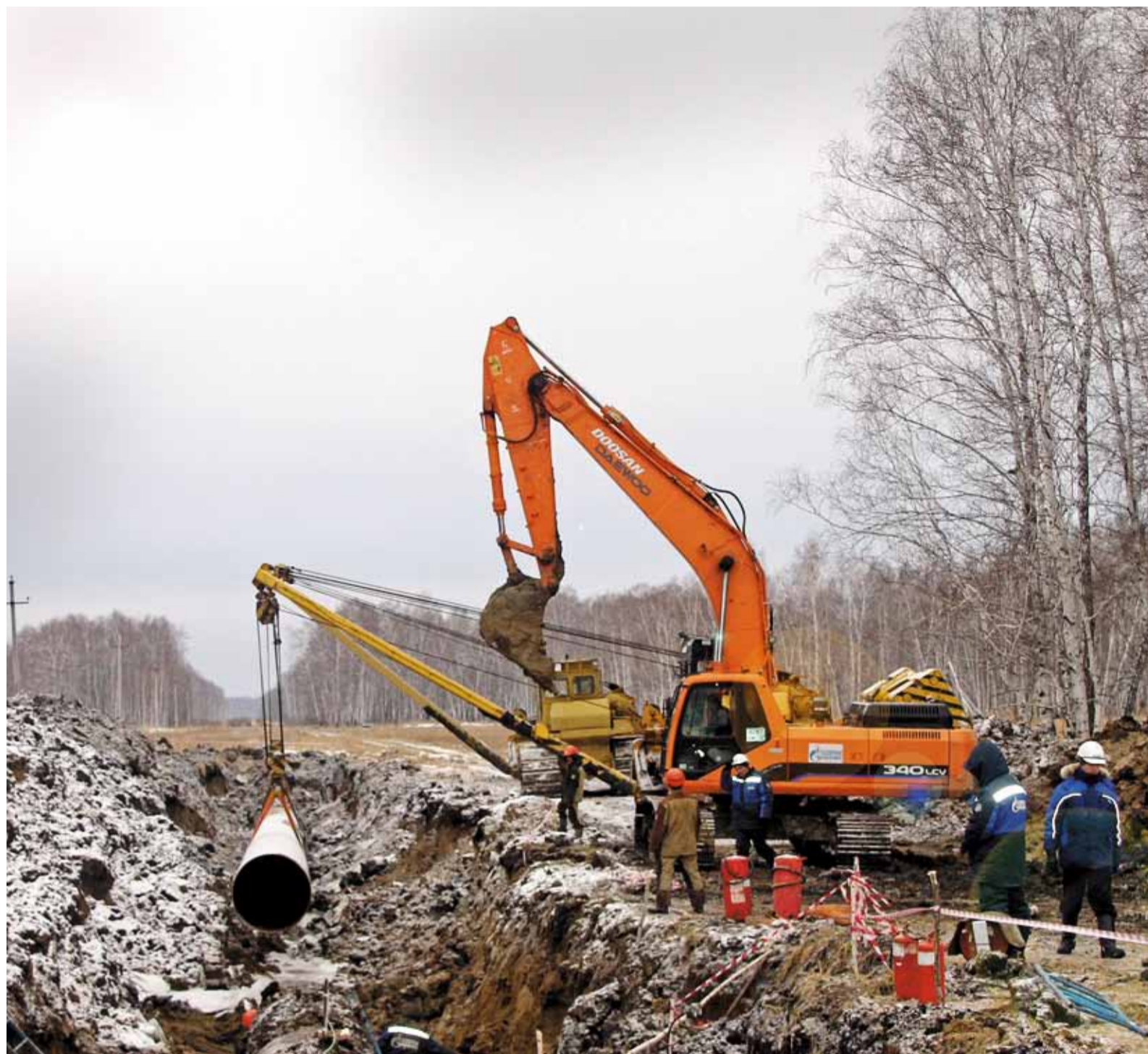
Самые крупные огневые прошли в ноябре в Барабинском ЛПУМГ ООО «Газпром трансгаз Томск»