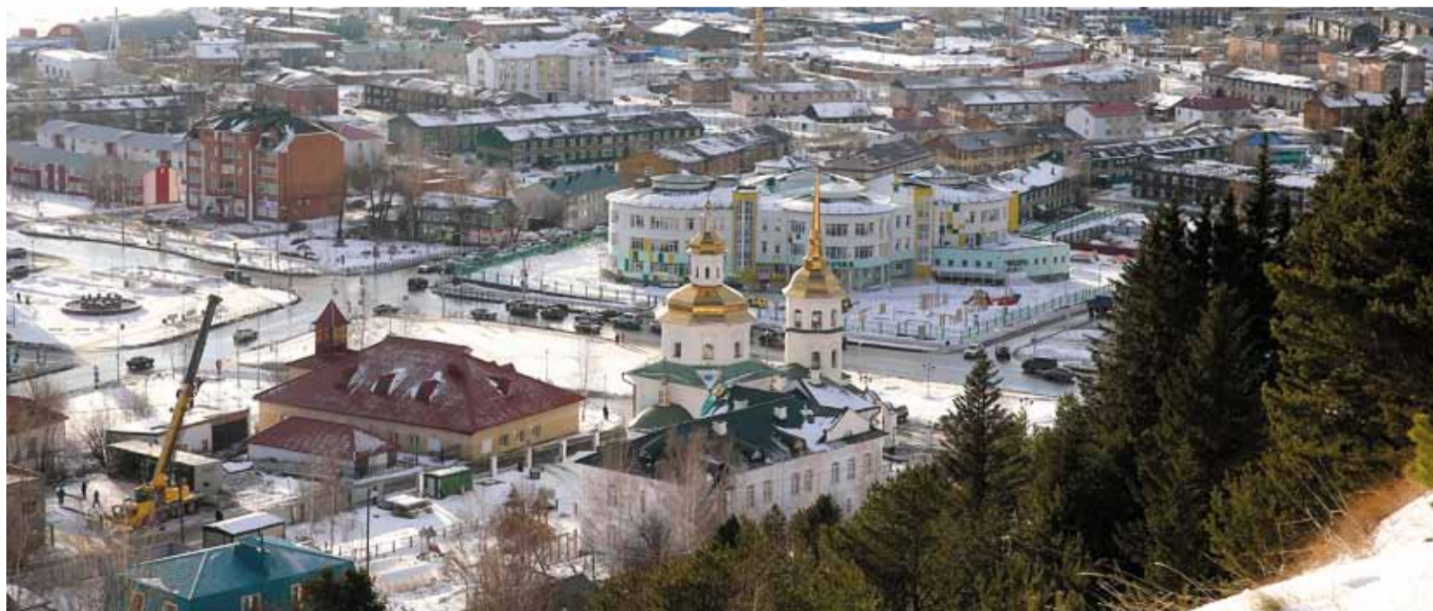
Ханты-Мансийск – город побед для творческой сборной «Газпром трансгаз Томск»