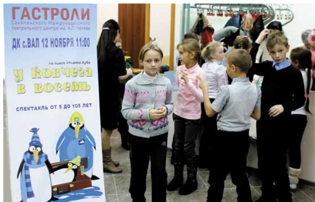
Каждый спектакль – неповторимый праздник для маленьких жителей из отдаленного поселка Вал

– Наша дружба с газовиками длится вот уже несколько лет, – рассказала исполняющая