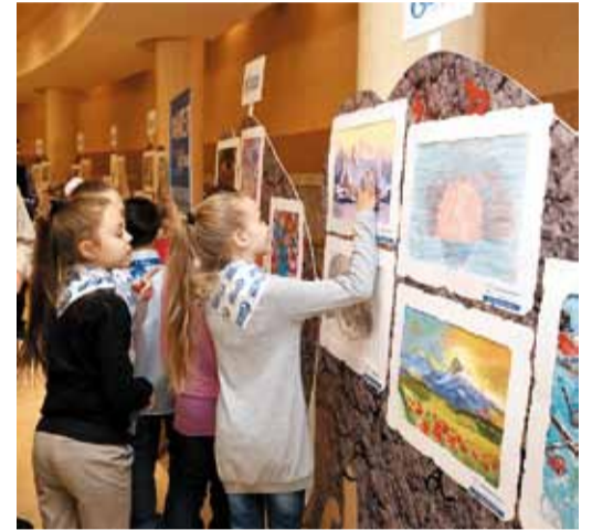
Искусство юных художников