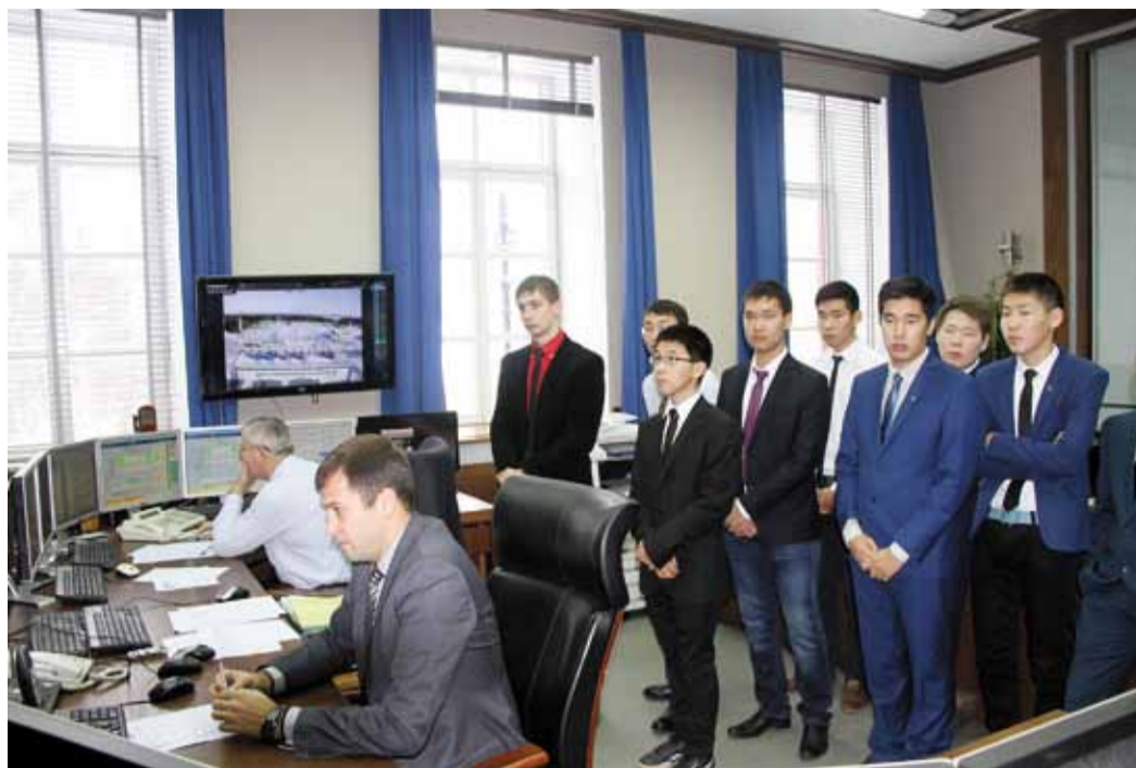
Не по учебнику, а на практике изучить работу газотранспортной системы – уникальная возможность для будущих газовиков

Выбор ТПУ очевиден. Этот вуз входит в число девяти опорных высших учебных заведений Газпрома, которые готовят кадры непосредственно для газовой промышленности. Учёба каждого из них – предмет пристального внимания в компании: именно предприятие согласовывает учебную программу и активно участвует в процессе обучения. В «Газпром трансгаз Томск» в этом смысле есть своё новшество: все целевые студенты проходят обучение в Корпоративном институте