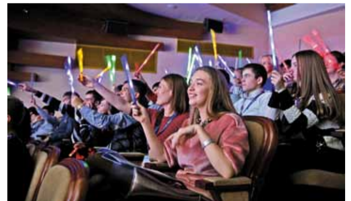
Лучшая команда в мире – Томск из Западной Сибири

Дебютантом «Факела» 2014 года стал ансамбль горского танца «Даймохк». «Даймохк» занял третье место на «Факеле». Но – это не поражение. Это – высокий уровень фестиваля. Это участники, приблизившиеся к профессиональной планке в своих номерах. Однако надо знать «Даймохк»! Он из тех коллективов, кто привык добиваться своего, не опуская рук даже тогда, когда не очень везет. Поэтому верится, что этот ансамбль добьется своего успеха на «Факеле».