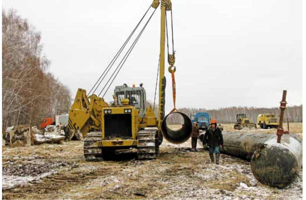
На 35 участках были сосредоточены специалисты и техника из шести филиалов предприятия, базирующихся в Томской области, Барабинске, Новосибирске и Омске